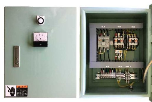
▲ 標準型スタータ：(左)外観 (右)内部