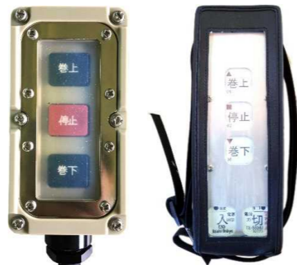
▲ 操作スイッチ：(左)標準型 (右)無線型

船揚場にはワイヤサバキ(乱巻防止対策)、ワイヤ押えローラー(ロープ張力抜け対策)などのオプション装置が必要な場合があります。また、動滑車(スナッチブロック)や方向転換シーブなどの関連製品も製作しています。